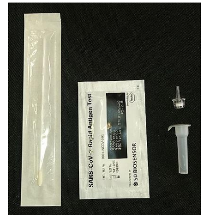
vollständiges Test-Kit: Teststäbchen, Testkassette, Pufferlösung und Deckel!